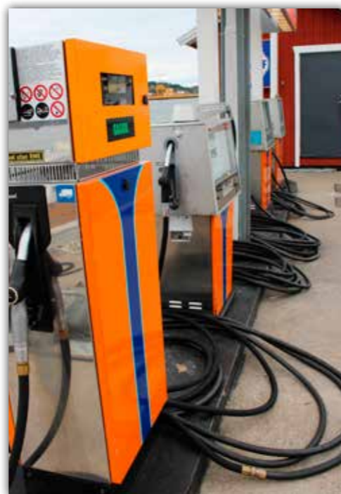
Diesel eller bensin? Det ena bränslet är grönt, det andra pumpas ur ett grönt munstycke - så vad beställer egentligen en kund som begär full tank grönt?

I slutet av augusti skickar vi ett brev till sjömacken med ett krav på 4 300 kronor i ersättning. Summan motsvarar omkostnaderna för att låta ett varv tömma tanken på 150 liter diesel/bensin, nya filter samt en full tank med diesel. Hittills har mackäga-