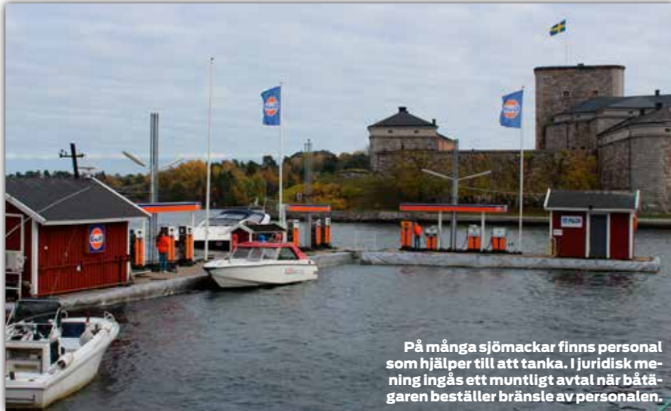
På många sjömackar finns personal som hjälper till att tanka. I juridisk mening ingås ett muntligt avtal när båtägaren beställer bränsle av personalen.