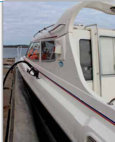
Enligt lagtexten är det befälhavaren ombord på båten som ansvarar för lastning, lossning och förtöjning. Det betyder att även tankning faller under befälhavarens ansvar.