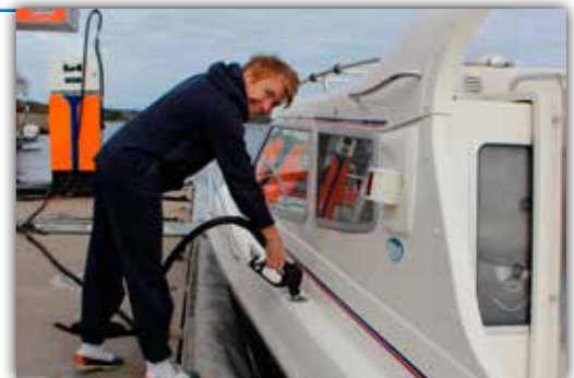
Ibland sker misstag och fel bränsle fylls på. Vår rundringning visar att exempelvis Gulf i Vaxholm (bild) för en dialog med de kunder som drabbats för att lösa det uppkomna problemet.

går i anläggningen. Sedan många år tillbaka är deras policy att båtägarna ska tanka sina båtar själva.