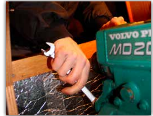
Att tanka bensin i en båt med dieselmotor kan få fördömande konsekvenser om misstaget inte upptäcks i tid.

Om en dieselmotor har körts på felaktigt bränsle bör man vara observant på tecken som kan tyda på att motorn fått skador. Det är om motoreffekten är dålig, det ryker mer än vanligt och motorn knackar.